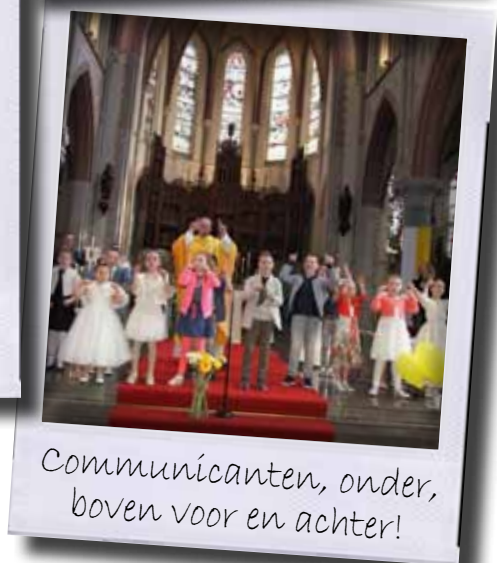
Communicanten, onder, boven voor en achter!