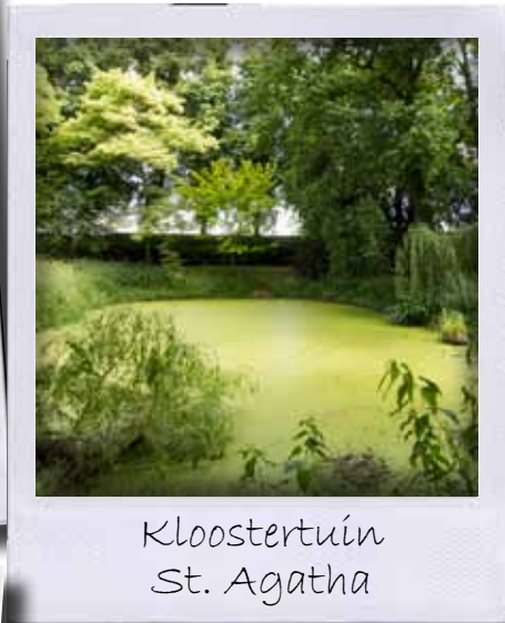
Kloostertuin St. Agatha