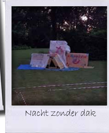
Nacht zonder dak